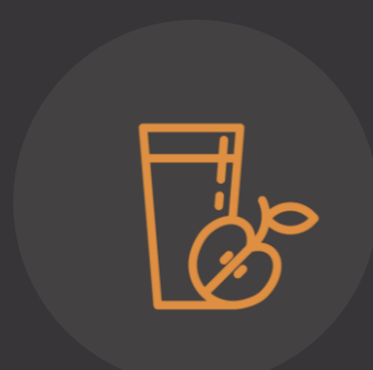
DESAYUNOS, ALMUERZOS Y JUGOS SALUDABLES