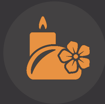
DÍA DE SPA