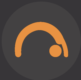
TALLERES DE BIENESTAR