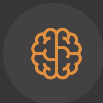
NEUROCIENCIAS Y BIENESTAR