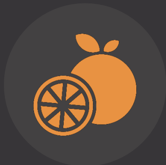
NUTRICIONISTA IN COMPANY