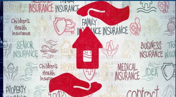
Insurance wearable & IoT technology