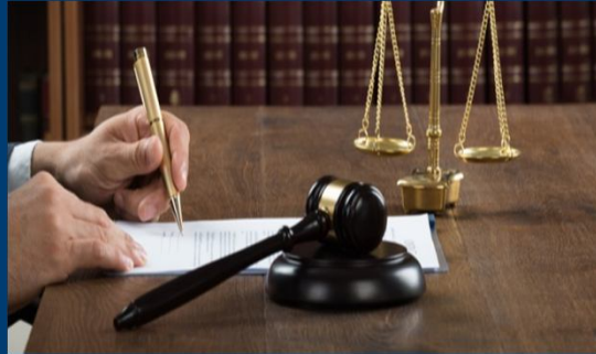
Cumplimiento & Regulaciones