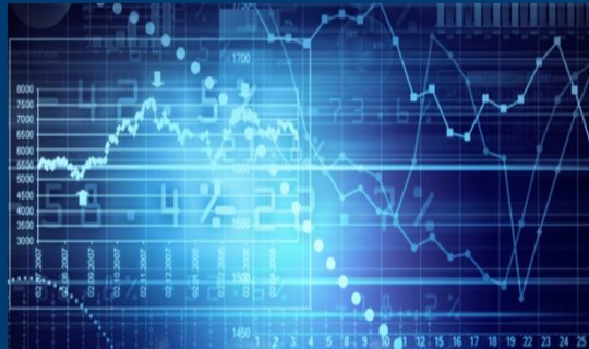
Análisis de información de Mercado