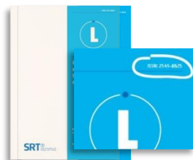
Registro de publicaciones con código ISBN (Cámara Argentina del Libro) y Código ISSN (CAICYT – CONICET)