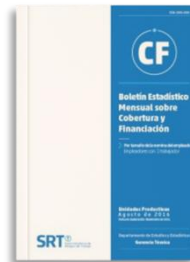
Boletín Mensual de Cobertura y Financiamiento por ART