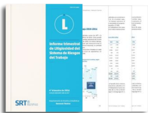
Documentación de línea editorial completa de publicaciones

dentro del Sitio Web Institucional SRT, exclusivo para la publicación de información estadística.