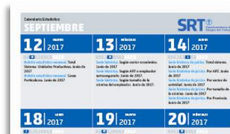
Cronograma de publicaciones