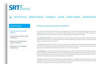
Principios rectores de la producción estadística