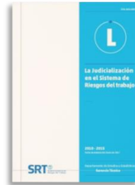
Boletín Trimestral de Litigiosidad del Sistema de Riesgos del Trabajo