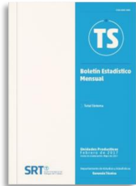
Boletín del Sistema de Riesgos del Trabajo. Nueva información sobre litigiosidad

Desarrollo de nuevos productos estadísticos sobre temas hasta entonces no considerados, como litigiosidad y precios de contratos del sistema