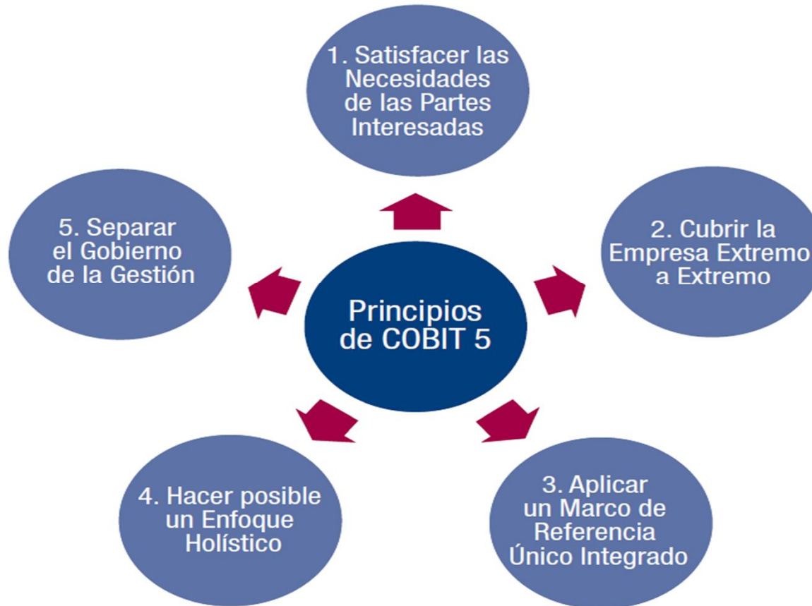
Figura 2—Principios de COBIT 5