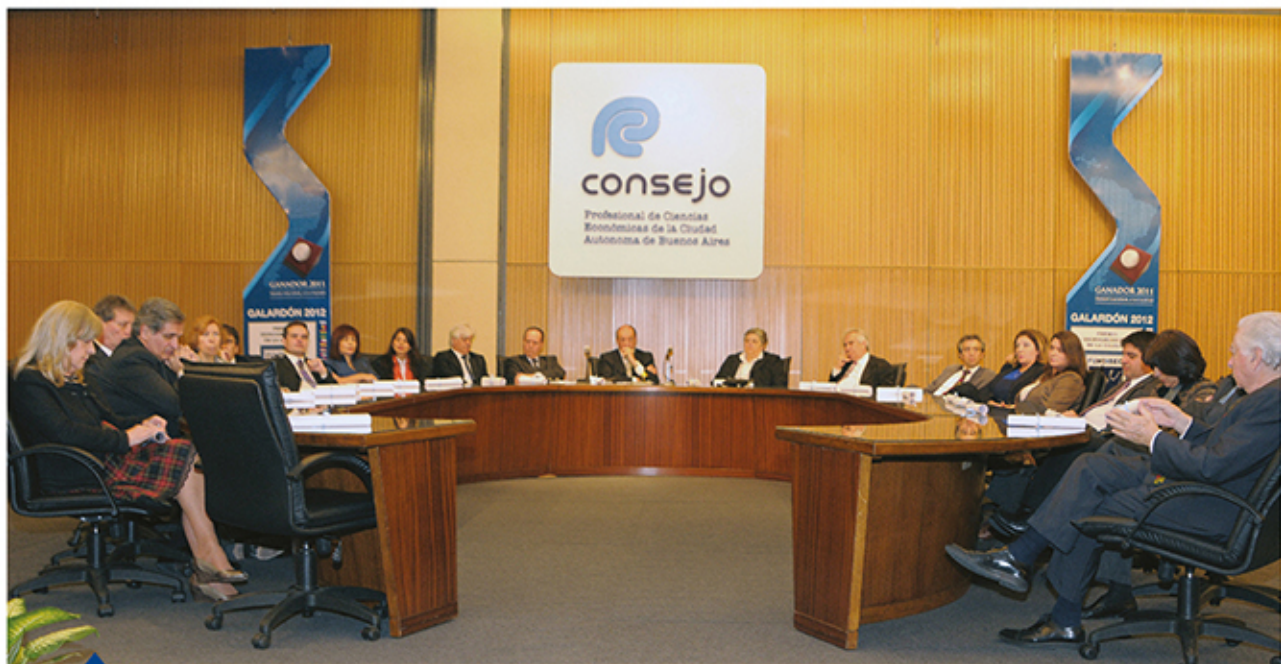
El nuevo Consejo Directivo que conducirá la Institución durante los próximos tres años