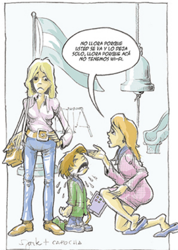
Guión: Capocha - Dibujos: Mark