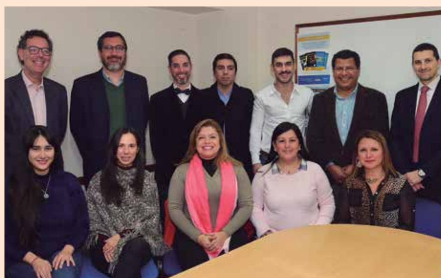
Los representantes de las entidades certificadas, durante la entrega de los diplomas.

A través de Profesionalidad Certificada, tu empresa, estudio u organización está colaborando con el cumplimiento de la Ley 20.488, que obliga a la inscripción en las respectivas matrículas a los Licenciados en Economía, Contadores Públicos, Licenciados en Administración y Actuarios. Tu aporte genera también grandes beneficios para vos y el personal a cargo. Por eso, trabajando en conjunto, lograremos un crecimiento mutuo.