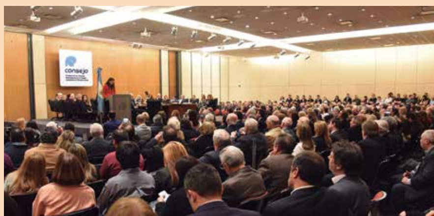
El acto de asunción tuvo lugar en el salón Dr. Manuel Belgrano de nuestra sede central.

Antes del acto y, según lo establecido en los artículos 59 y 9 de la Ley 466 de la Ciudad, y en el artículo 10 del Reglamento Interno del Consejo Profesional, la Mesa