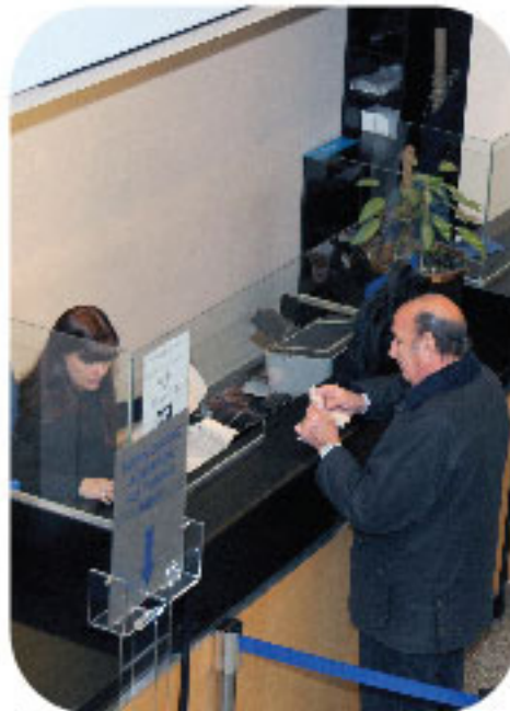
Cajas de la IGJ en el Consejo

Por su parte, el plazo para las Sociedades Extranjeras acaba de vencer el pasado 30 de septiembre.